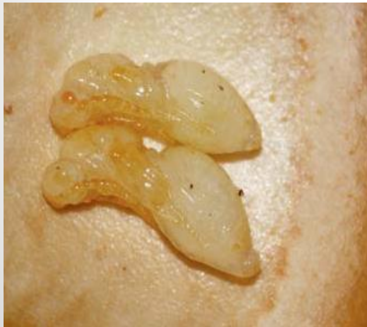
Kukly po zakuklení larvy