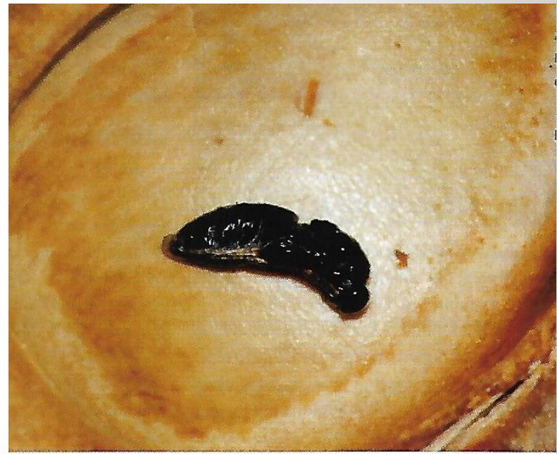
Kukly před vylíhnutím